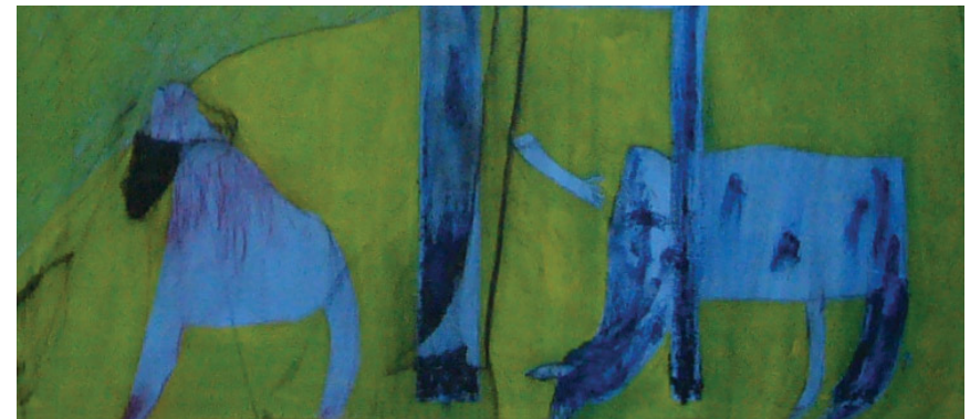
Fig. 6. Espectral Requiem , Oleo s/tela 176 x 262 Detalle. De la muestra Spaghetti Western . Galería FORUM. Lima -Perú