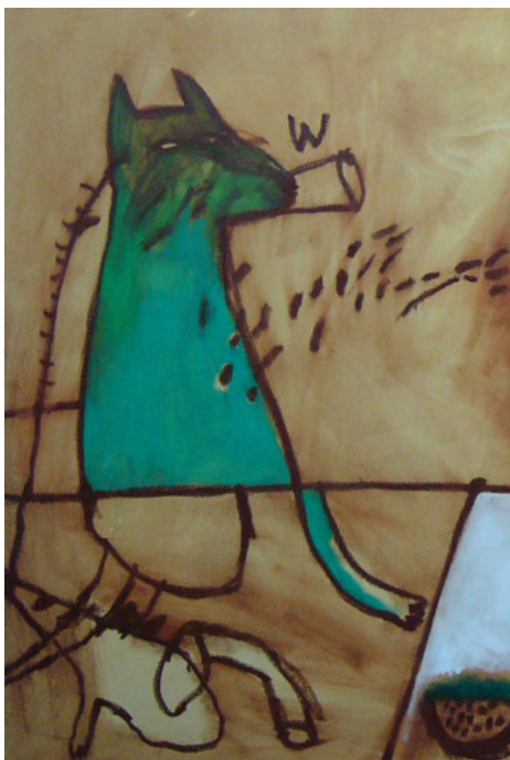
Fig. 7. Perro Verde , Oleo s/tela, detalle, 100 x 120 cm. De la muestra Spaghetti Western . Galería FORUM. Lima –Perú