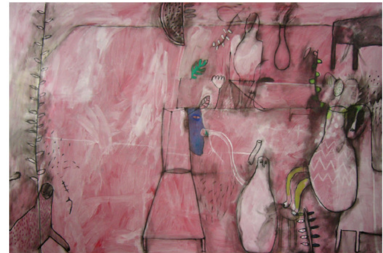
Fig. 2. Almuerzo sobre la Hierba , Oleo s/tela 200 x 300 cm. De la muestra Spagheti Western . Galería FORUM. Lima -Perú