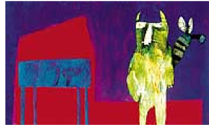
Fig. 1. Obra s/t. , Oleo s/tela, 44 x 80 cm. De la muestra Prontuario . Galería FORUM. Lima -Perú

Los personajes pequeños que recorren cada cuadro en la obra de Giorgio son el hilo conductor de la lectura de su obra pictórica. Tienen roles cortos pero fuertes en contenidos, sin ellos la obra de Giorgio no tuviera vida de historia y relato cotidiano (Figura 6 y 7).