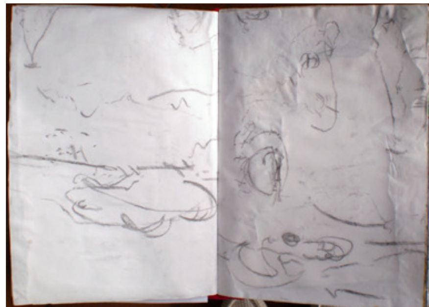
Figura 2. Un ejemplo de doble página del libro sin intervenir.

anterior, sin mirar el papel. Este sistema produce una multiplicación de extremidades y rostros, formas desplazadas y transparentes. Sobre este proceso de trabajo he seguido y en parte soy deudora de el (Figura 2).