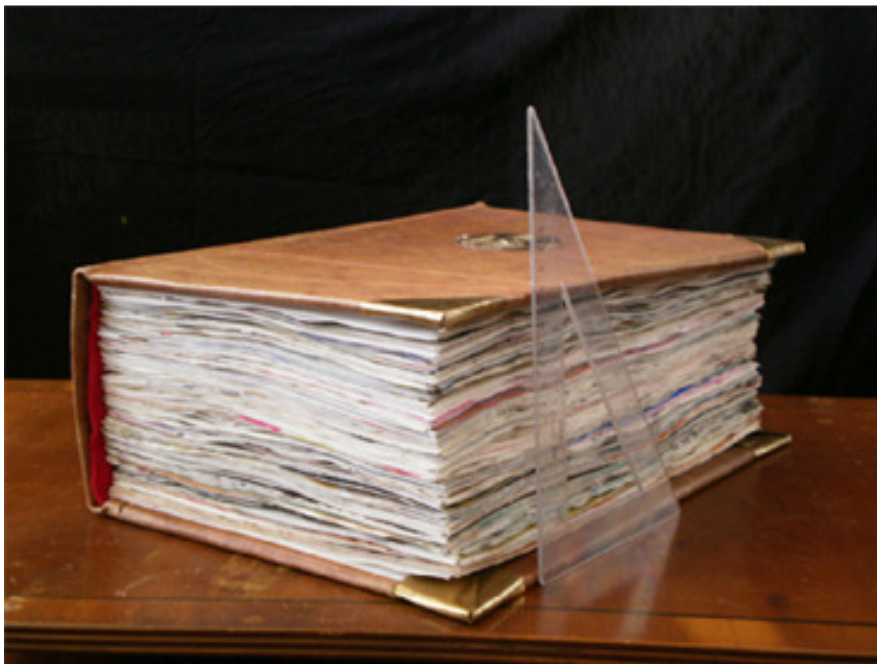
Figura 1. El libro Este es mi cuerpo .

que me ha motivado a recogerlos y usarlos ha sido una intuición de que podría trabajar encima de ellos y con lo que contenían.