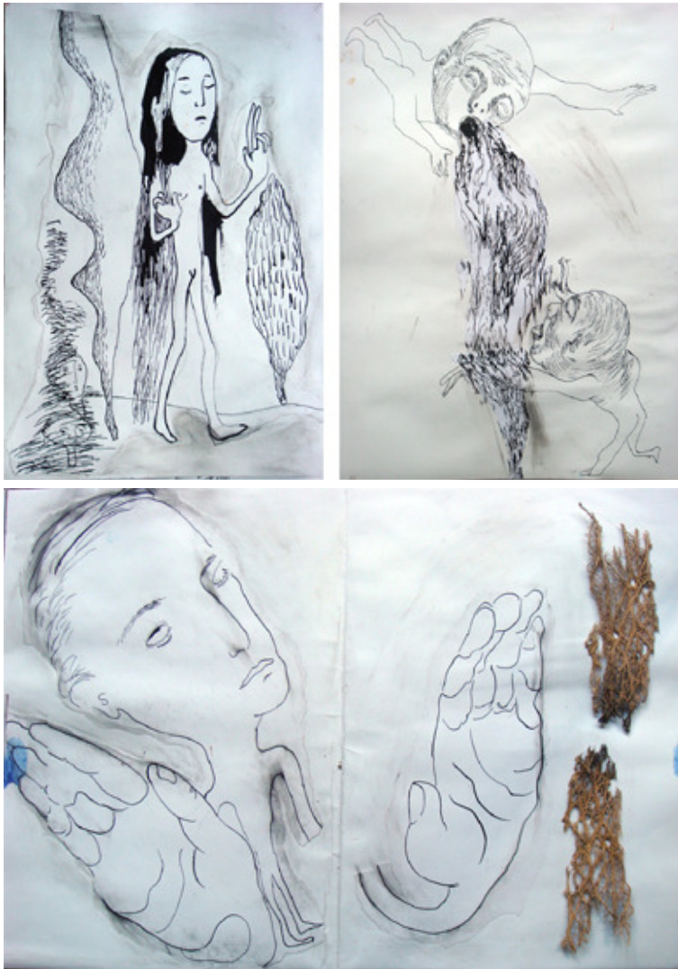
Figuras 9 y 10. Arriba, dibujos del reverso de algunas páginas. Abajo, la intervención en doble página utilizada como boceto para una imagen múltiple de 80 x 120 cm.

decía que el arte está contaminado de arte. Esto es especialmente verdad para los creadores. Asumir esta realidad conscientemente abre la puerta a la creatividad. •