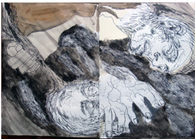
Figuras 3 y 4. Páginas dobles del libro, intervenidas. Los originales de arriba dibujados de forma muy sintéticas, los de abajo con detalle y texturas. Las mutilaciones, giros y repeticiones del cuerpo son propios del sistema de doblado de los originales para la encuadernación.