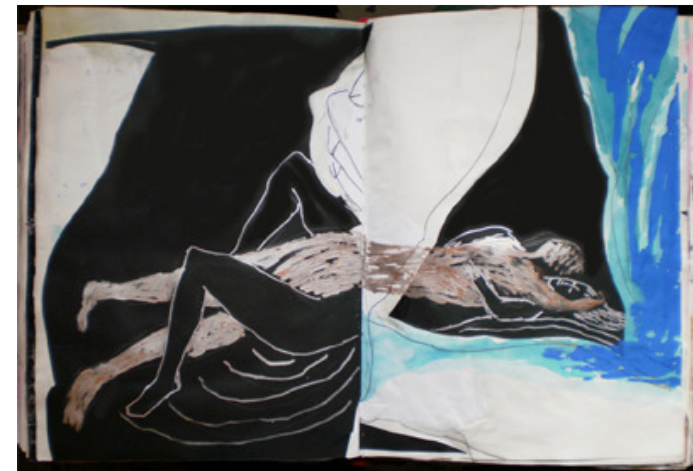
Figuras 7 y 8. Fases del proceso de intervención de dos páginas dobles. Abajo original con collage de cartulina negra; la intervención introduce personajes a otra escala.

Este proceso ha facilitado el trabajo de intervención, evitando el pánico de la hoja en blanco y del papel virgen, especialmente si el precio es elevado. Ayuda a hacer los dibujos del cuerpo humano, que, por estar nosotros representados en ellos, inhiben (Figuras 9 y 10). Toma el tema del CSO'2010 creadores sobre otras obras literalmente, al utilizar las otras obras como soporte, subvierte o ironiza la proposición. Cuando uno se permite dibujar mal, siente liberación. El artista Saul Steinberg