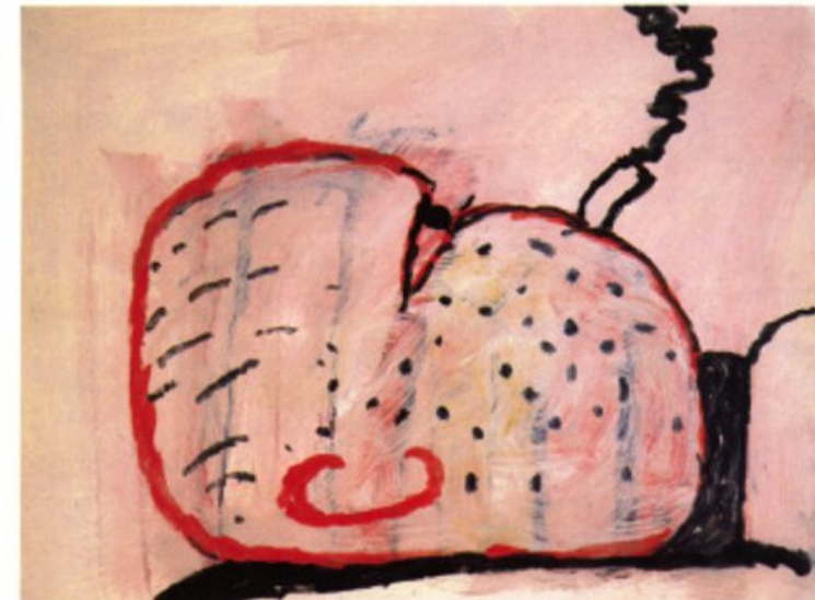
Figura 3. Philip Guston, Pensaments , oli damunt paper 58,5 x 73 cm 1972.