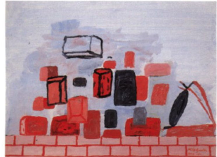
Figura 2. Philip Guston. Roma , oli damunt paper 56 x 76 cm 1971.