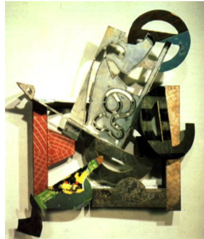
Figura 5. Frank Stella, Marsaaxlokk bay , tèc. Mixt./metall 225 x 350 x 35 cm. 1983.

Levitut, exactitut, visibilitat i multiplicitat hi son presents (Figuras 4, 5).