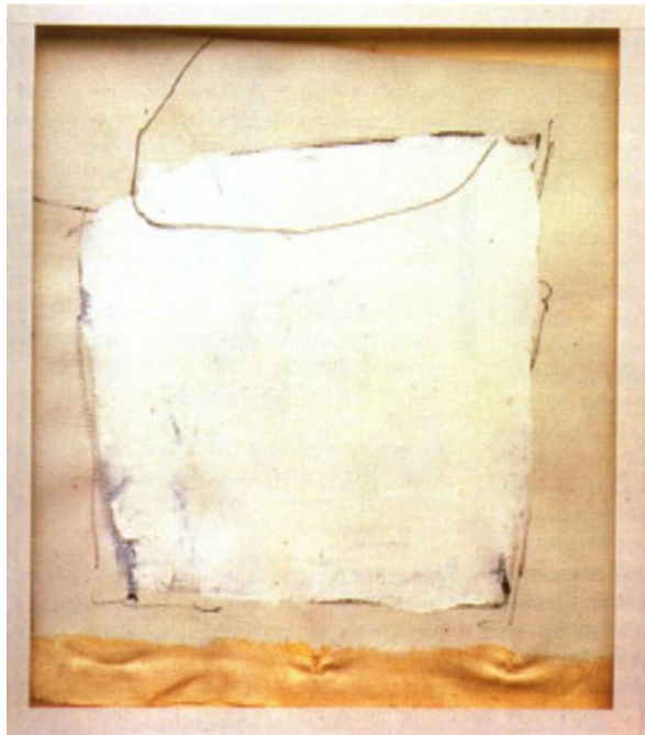
Figura 1. Robert Ryman, Sense titol , Oli / fusta 55x55 cm 1957.

Rapidessa, exactitud, visibilitat i multiplicitat hi son presents.