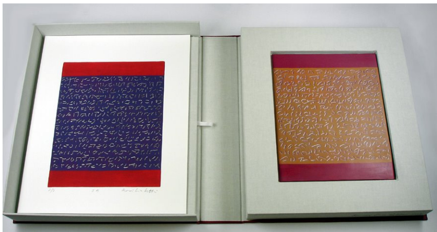
Figura 2. Maria Lucia Cattani, Quadrantes-Quadrants, Caixa : Gravura digital, jato de tinta e corte a laser sobre papel, 25,5 x 20 cm e Painel, corte a laser sobre tinta acrílica sobre gesso, 25,5 x 20 cm, 2008

interferência direta da mão da criadora. Com grande definição e extrema delicadeza de textura, são facilmente confundidas com impressões artesanais.