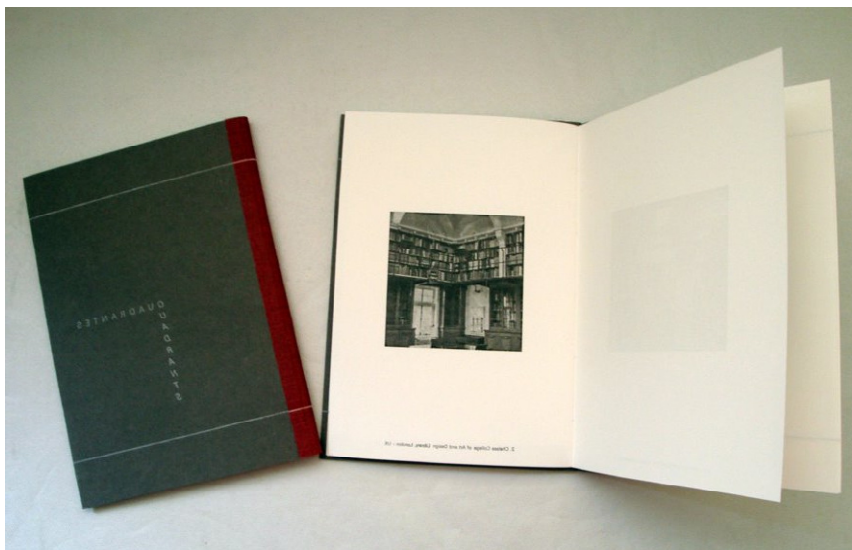
Figura 3. Maria Lucia Cattani, Quadrantes-Quadrants, Livro-de-artista , 2008 (fot: MS)

O livro-de-artista, composto manualmente e impresso em tipografia, contém uma versão reduzida das gravuras impressas em jato de tinta, fotografias das Bibliotecas em tipografia e um fragmento original (lápiz sobre papel) da caligrafia desta escrita inventada (Figura 3), enquanto o vídeo que acompanha as instalações foi gerado a partir de fotos destas mesmas bibliotecas (Figura 4). No vídeo, as manipulações provocadas alteraram substancialmente as fotografias originais que, repetidas, espelhadas e justapostas, receberam tratamento gráfico que criou imagens instigantes uma vez que o espelhamento não é total.